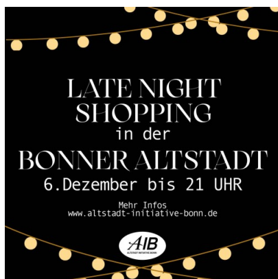
Late Night Codierung beim ADFC