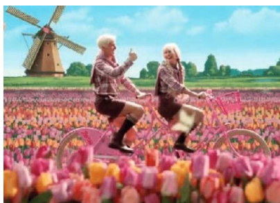
"Barbie", USA 2023, Komödie von Greta Gerwig