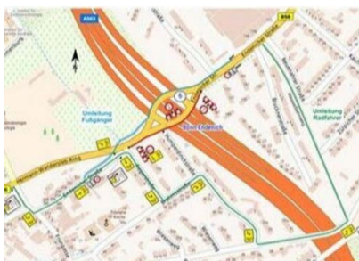
Grafische Darstellung für die seit 13. Nov. 2023 geltenden Umleitungen für Fußgänger*innen (blau) und