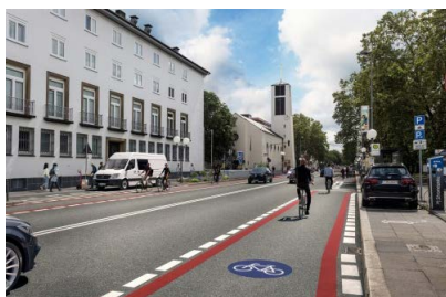
Adenauerallee am Juridicum - künftig

Die Ergebnisse der Befragung tragen dazu bei, die Bedeutung von Radreisen und Tagesausflügen mit dem Rad sichtbar zu machen. Mehr zur ADFC-Radreiseanalyse und zum Gewinn